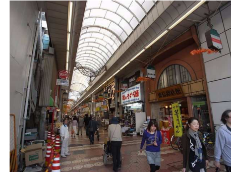
ルミエール商店街徒歩1分