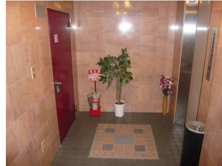
オシャレなエントランス