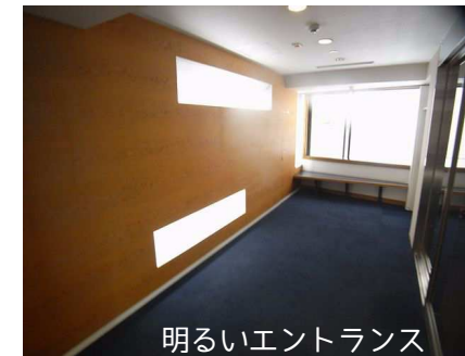
明るいエントランス