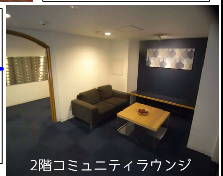
2階コミュニティラウンジ