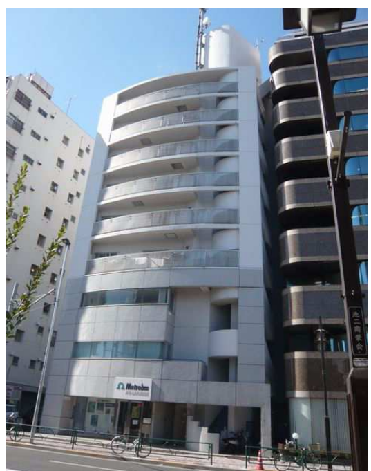
根津駅徒歩2分の好立地