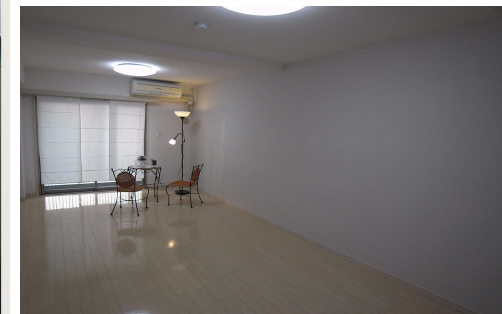
11.7帖のスーパー1Kでゆとりライフ