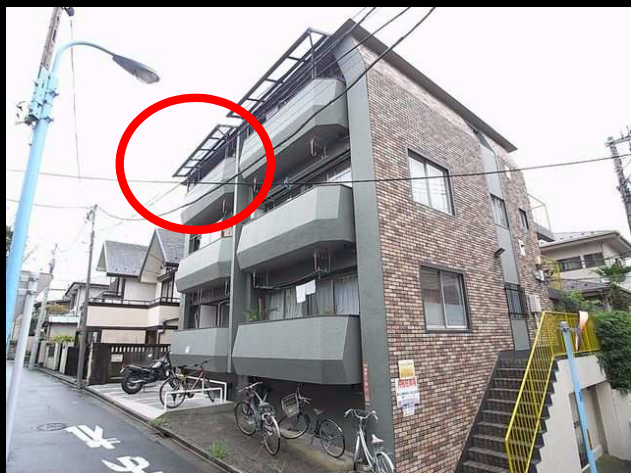
南向き二面採光角部屋中二階