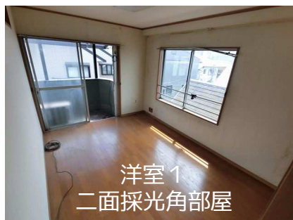
洋室1 二面採光角部屋