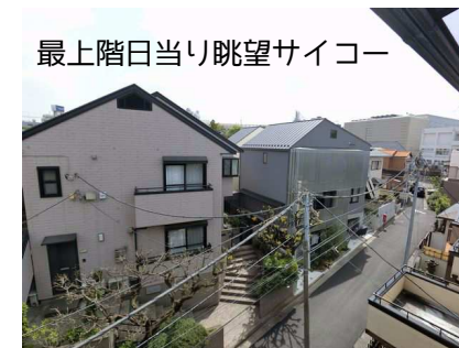
最上階日当り眺望サイコー