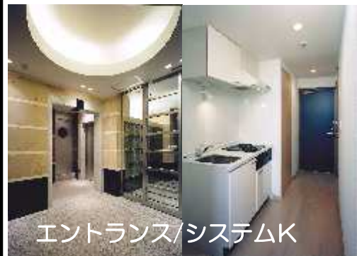
エントランス/システムK