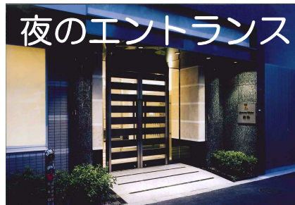
夜のエントランス